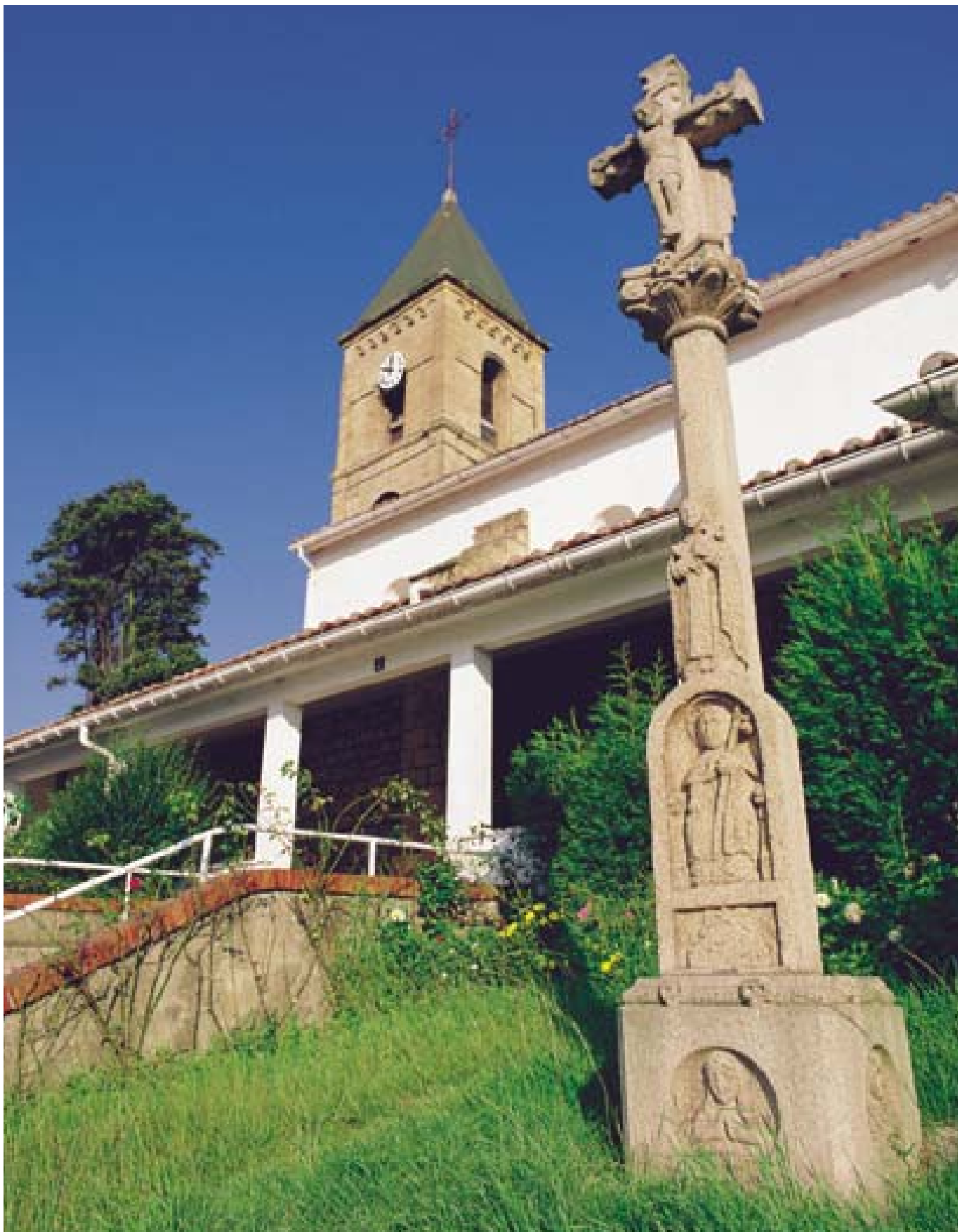
La Iglesia de San Juan, modificada en varias ocasiones, presidía hacia los años 70 una zona verde que actualmente se está transformando. Autor Asier Bastida.