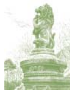
León de la puerta de acceso del Palacio Artaza. Dibujo: J.L. Agirre

El edificio se ubica en un amplio solar irregular de casi 30 hectáreas, topográficamente accidentado, localizado en el Arenal de Artaza, que es el que da el nombre a la casa. Estos terrenos fueron subastados por el Estado en 1894.