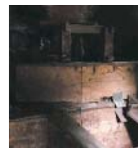
Guardapolvos o cubierta de madera que protege las muelas y evita tanto que se genere polvo y salga la harina, como que se cuelean elementos extraños. A la izquierda podemos observarlo retirado y a la derecha en su posición correcta sobre el único par de muelas que se conserva.