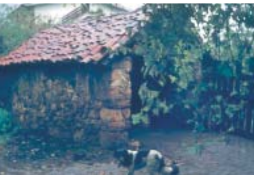
Horno del caserío Etxebarria en Aketxe. Años 70.