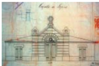
Plano de la Capilla del Cementerio de Leioa. Proyectado por Marcelino Arrupe en 1899. ADFB. Sección Municipal. Leioa. Negociado de Fomento. CAJA B-1.

El actual, objeto de numerosas reformas, se construyó a finales del siglo XIX por la necesidad de ampliar otro que venía utilizándose desde principios de ese mismo siglo, y tras la prohibición -tardíamente acatada- de enterramiento en el interior de las iglesias.