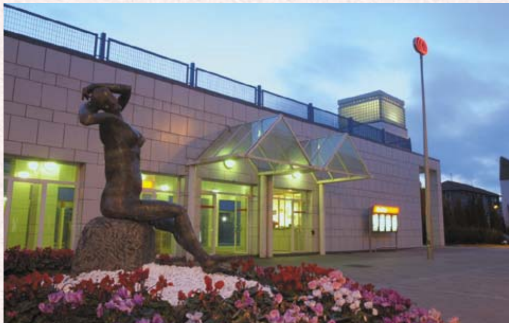
Estación de metro de Lamiako. Autor Asier Bastida