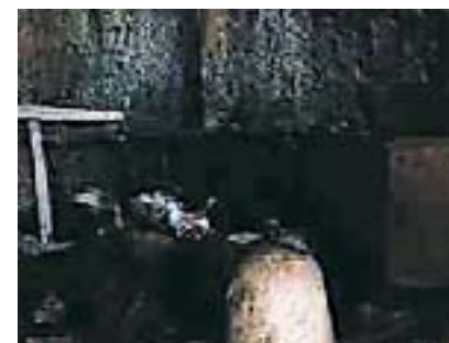
Pesa de piedra.