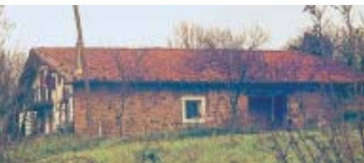
Caserío Leioagoiti en Elexalde. Años 70

Cercano a la cumbre de la colina Leioandi, data de los siglos XVI-XVII. Este caserío da nombre al municipio; de hecho, su tipología constructiva es la más arcaica: en la fachada aún no hay portalón, elemento ligado a la paz y prosperidad; el acceso se hace mediante un patín o escalera exterior, como en las torres medievales.