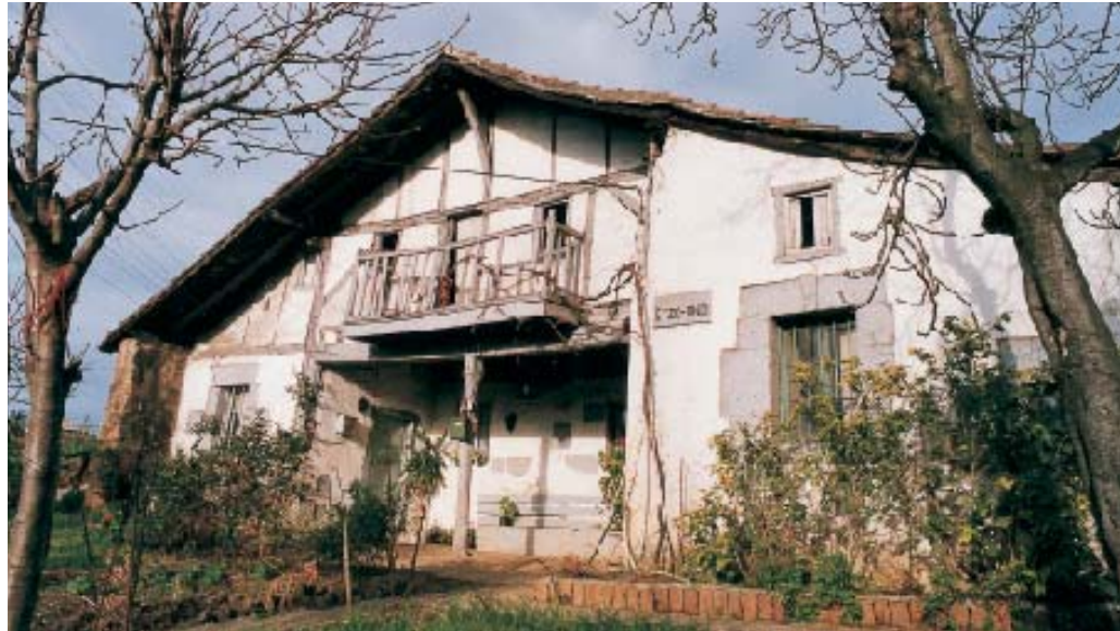
Caserío Etxeandi en Aketxe. Autor Asier Bastida

Este edificio, que data probablemente de época renacentista, tiene cubierta a dos aguas, tornavuelas que refuerzan el vuelo del tejado, portal adintelado y el característico entramado de madera en el segundo piso. Junto a él hay un pozo. Pese a su antigüedad y las reformas a que ha sido sometido, su estado de conservación es bueno.