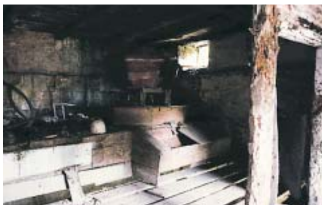
Sala de molienda: la tolva, el caballete o burro con restos de cadillo, el guardapolvos que cubre las muelas y la vertedera hacia el aska o harinero, situada en la parte delantera.