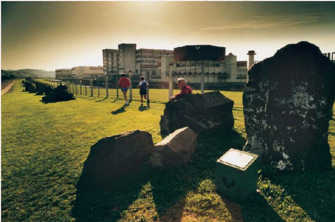
Universidad del País Vasco. Leioa. Autor Asier Bastida