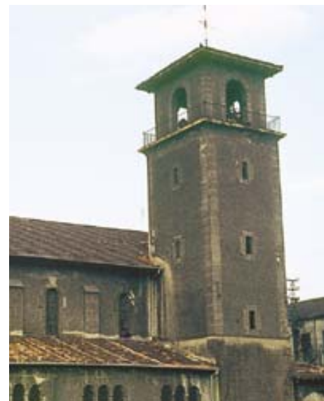
La iglesia de San Máximo de Lamiako, construida a principios del Siglo XX, toma su nombre de Máximo Agirre, ya que fue erigida en terrenos de su propiedad.