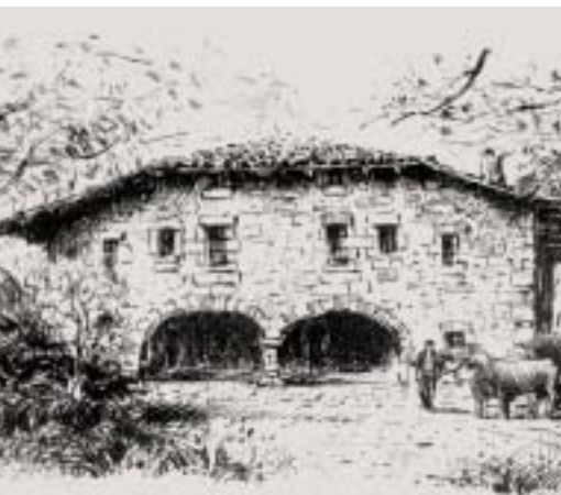
El Palacio Mendibile, que data de los siglos XVII-XVIII, es uno de los edificios más importantes de Leioa. Dibujo: J.L. Agirre

A partir de los datos que nos ofrecen las fogueraciones, a las que hemos aludido en otros capítulos, podemos conocer el número de caseríos que existían en Leioa, y no solo eso, sino también quiénes y cuántas familias vivían en ellos, si los tenían alquilados, si estaban endeudados, en qué estado se hallaban, etcétera. Datos interesantes todos ellos para conocer un poco mejor los modos de vida de los leioarras de siglos pasados.