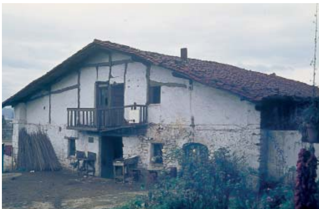
Caserío Kortasene. Años 70