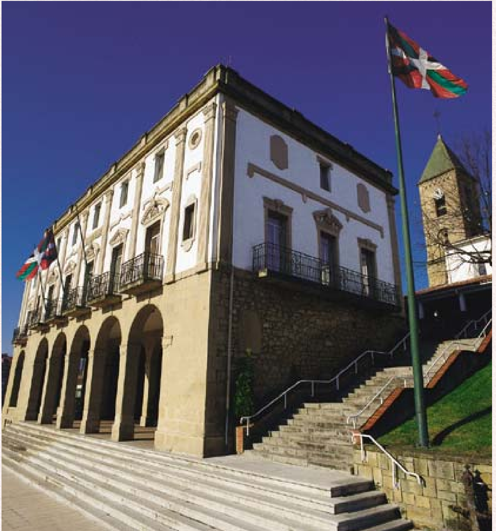
Ayuntamiento de Leioa. Autor Asier Bastida