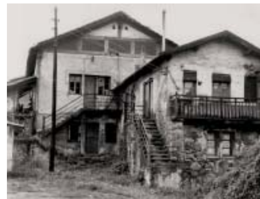
Caseríos de Udondo.

La importancia de los cereales en la dieta occidental y la necesidad de contar con un instrumento que permitiese la trituración del grano, hicieron que el molino se convirtiese, hasta un pasado muy reciente, en un elemento habitual en el paisaje y la vida cotidiana de las sociedades eminentemente agrarias.