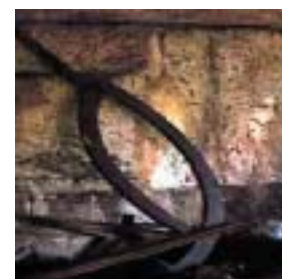
Tenaza metálica y tornillo que aún se conserva en el banco de molienda.

Actualmente, dado su interés desde el punto de vista histórico y arquitectónico, está siendo rehabilitado y su recuperación nos permitirá conocer cómo funcionaba un molino de estas características en el pasado.