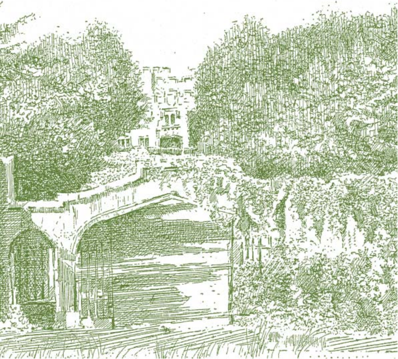
Dibujo J.L. Agirre