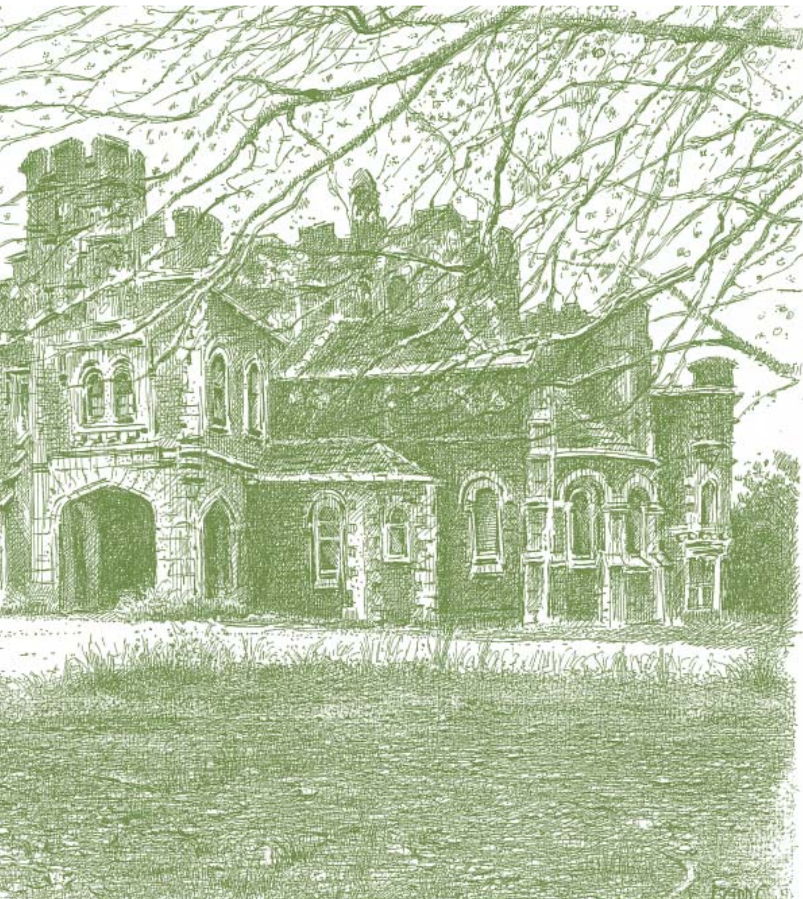
Dibujo J.L. Agirre