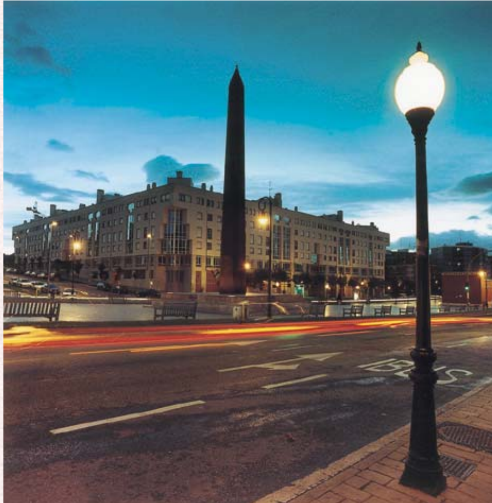
Obelisco de Leioa. Autor Asier Bastida