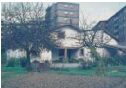
Caserío Bidekurtzio rodeado de nuevas edificaciones.

De la bolera, oculta tras el horno, tan solo se aprecia -semioculto por la vegetación- el lugar donde en su día se dispuso el carrojo.