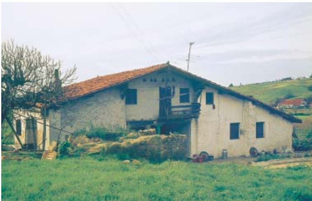
Caserío Larrakoetxe en Peruri. Años 70

A mediados del siglo XVII era propiedad de la viuda Catalina de Lejonagoitia, que en 1651 fundó sobre él un censo de 50 ducados 177 . Entre sus características podemos citar la escasa altura si se compara con su anchura y longitud, el tamaño reducido de las ventanas, el voladizo del tejado sustentado por jabalcones y los vanos para palomas, entre otros.