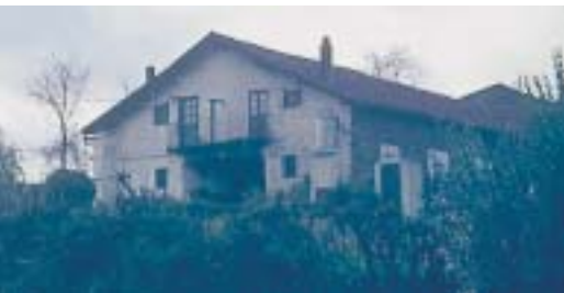
Caserío Jauregi en Ondiz. Años 70

Otros caseríos destacados en esta zona son Etxe-Zuria 173 , Sagasti 174 , Alangoetxe 175 Iturriena, Iturrikoetxea, Aurrekoetxea, Indurriena o Indurriñe y Matximoena.