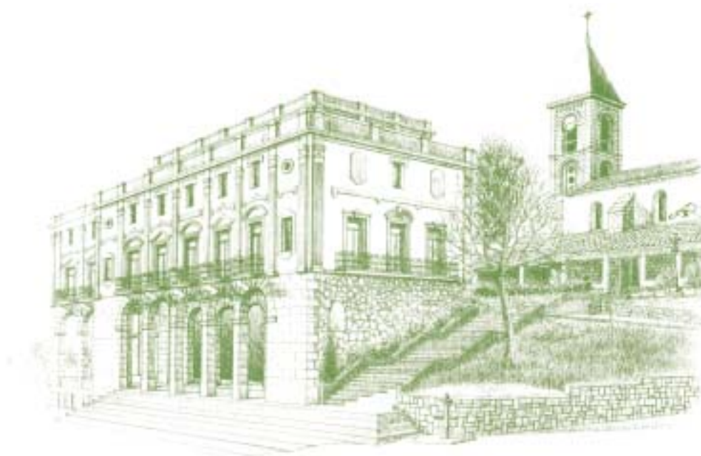
El Ayuntamiento de Leioa, construido a finales del siglo XIX, constituye, junto con la Iglesia de San Juan, uno de los conjuntos más emblemáticos de la anteiglesia. Dibujo: A.R.

Construida de nueva planta en 1891 en el mismo lugar en que se alzaba desde principios de siglo y en estilo neoclásico, fue objeto de ampliación y mejora en 1986 y 1991. Semejante en su eclecticismo a los edificios de los ayuntamientos de Portugalete y Santurce, consta de un cuerpo principal de tres alturas al que posteriormente se le añadió otro retranqueado de menores dimensiones. Sobre los arcos de medio punto a los que se accede por una escalinata, se eleva la primera planta, con vanos de dinteles decorados de forma alterna. En la segunda planta, los vanos están separados por unas bandas acanaladas. Existe una tercera planta, construida por necesidades de espacio, pero no ofrece ningún interés desde el punto de vista arquitectónico.