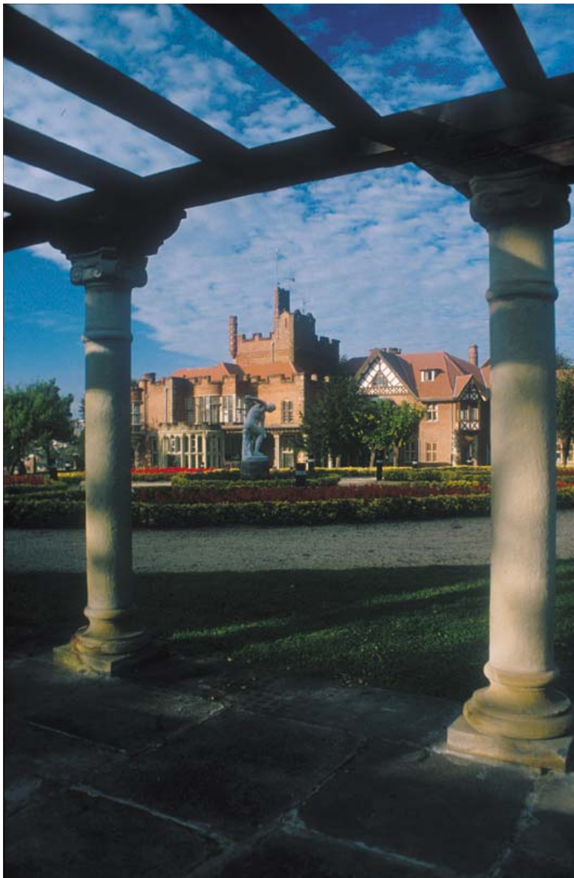
El Palacio Artaza desde la Pérgola. Autor Asier Bastida.